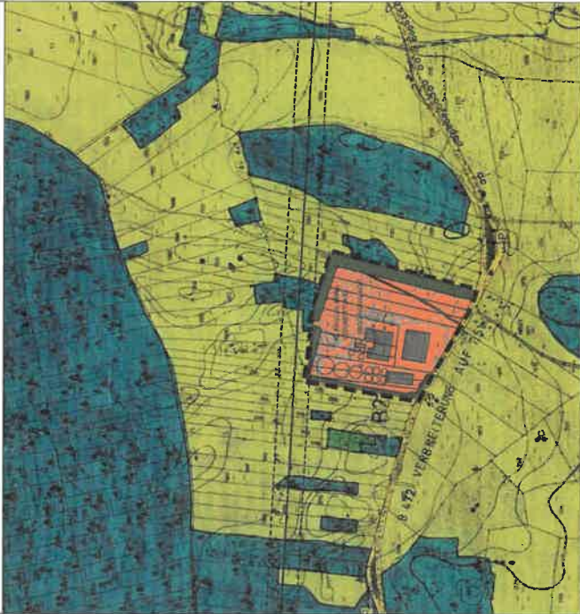
A2 AUSSCHNITT AUS DEM GEÄNDERTEN FLÄCHENNUTZUNGSPLAN