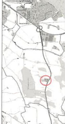
AUSZUG AUF DER TOPOGRAPHISCHEN KARTE, DINKE MARSHALL